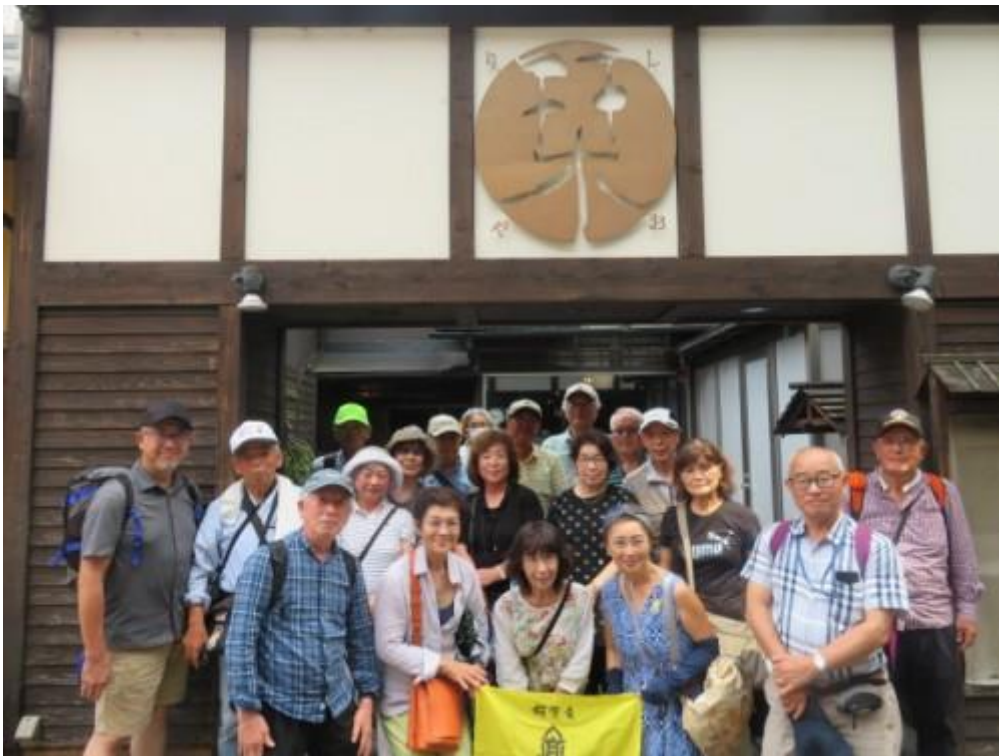
※宴会・反省会でお世話になった菜屋